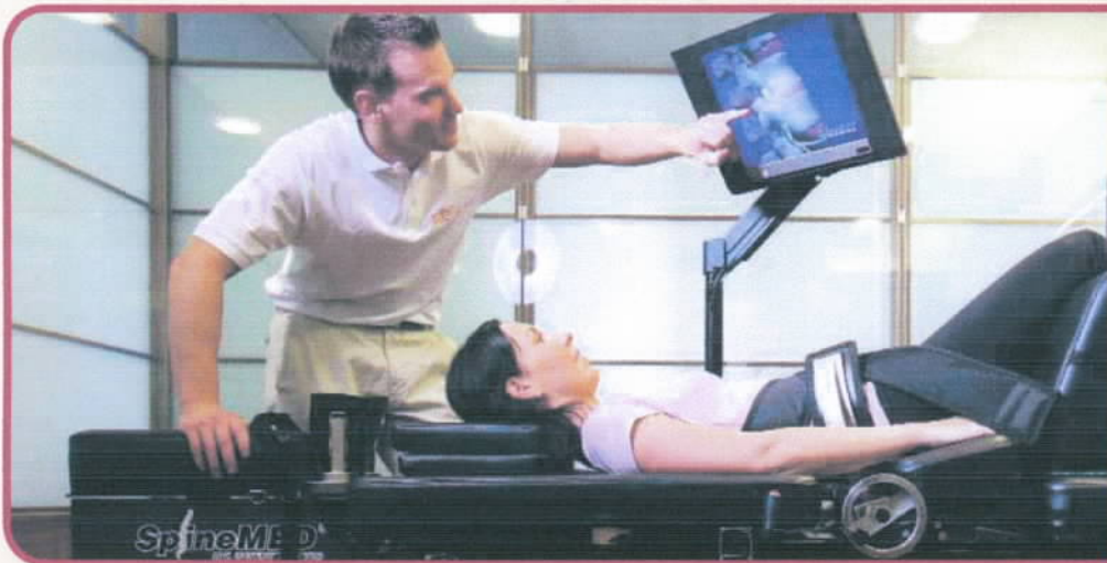
Spinale Dekompression mit dem SpineMED® Table